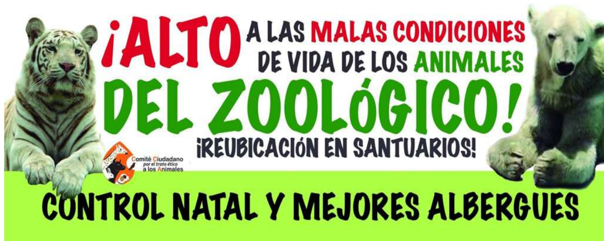
Foto 3, Comité Ciudadano para el trato ético a los Animales. 2014. Facebook.

después decidí asistir al que sería mi primer mitin en contra del zoológico en 2014. La asociación conocida como Generando Hogares de Amor para Animales Desprotegidos (GHAPAD) llamaba a dos cosas en particular: La primera, la santuarización y la segunda poner un alto a las malas condiciones en que se encontraban los animales.