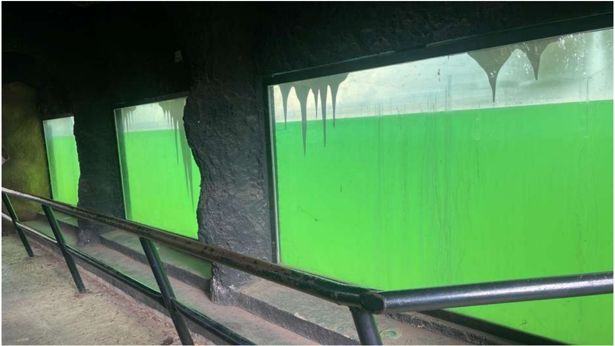
Foto 2. Así luce actualmente el lugar dónde estaba cautiva Yupik.