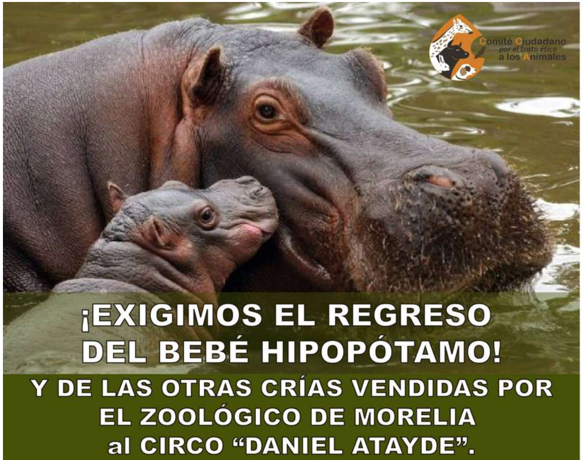
Foto 6, Comité Ciudadano por el trato ético a los Animales, 2014. Facebook.

Sé que a lxs médicxs veterinarixs los educan para ver a los animales con objetividad porque son sus pacientes y que por ende no deben ser sentimentales para poder tratarlos así porque si son empáticos entonces no podían tratarlos objetivamente. Pero esta es una de las aristas de la discusión entre activistas y veterinarixs. Que ellxs con tal de continuar con sus trabajos o recibiendo una remuneración económica no hacen ni dicen nada sobre la explotación de los animales silvestres haciéndonos creer que los animales están mejor en el zoológico que sus propios hábitats. Esta y otras situaciones como las jaulas muy pequeñas para los animales, el descuido de los espacios que habitan los animales han generado una confrontación entre quienes tienen intereses políticos o económicos en los zoológicos y aquellos que buscan un cambio en favor de los animales.