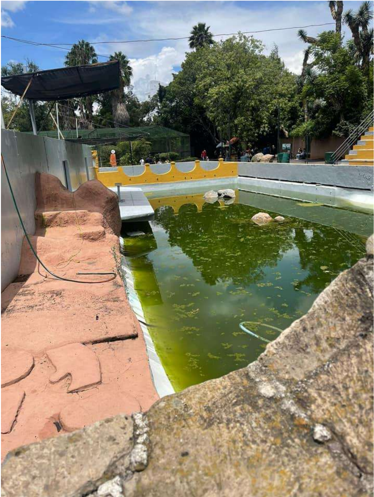
Foto 3. Así luce actualmente el lugar dónde estaba cautivo y daba show Lobby. Esquema Noticias, 18 de julio 2022.