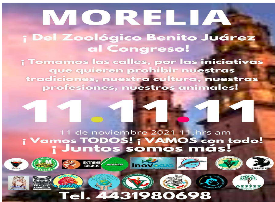
Foto 1, Obtenida de Facebook. Algunos de los logos corresponden a los siguientes convocantes: FM Regius (criadero de animales), Extreme Gekos (criadero de mascotas exóticas), Inovacuo (acuario), Los Laloos (reproducción de aves de presa), Vigilante Facultad de Veterinaria, Médicos Veterinarios y OEFFEX (empresa dedicada a la creación de eventos sobre fauna y flora exótica).