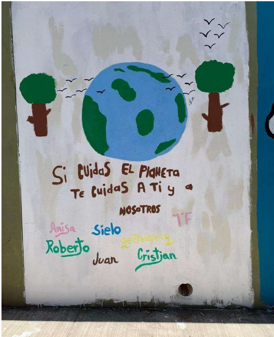
Imagen 11. En este grabado los alumnos del 1: F muestran una imagen limpia del mundo, con dos árboles y una parvada de aves que vuelan de un lado a otro del planeta. Es de resaltar la frase que expresa comunalidad en sus líneas.