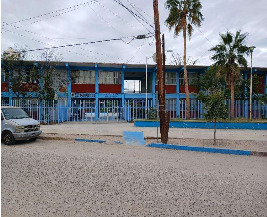
Imagen 6. Entrada principal de la escuela secundaria Humberto Muñoz Zazueta en La Paz Baja California Sur, esta se encuentra por la calle Urbano Angulo, se puede ver que cuenta con rampa de acceso para discapacitados y cerco perimetral.

belleza, electricidad, estructuras metálicas y artesanías. la infraestructura contaba con cuatro aulas, baños de niños y de niñas, un laboratorio, un taller, así como la plaza cívica, no había barda y cerco perimetral.