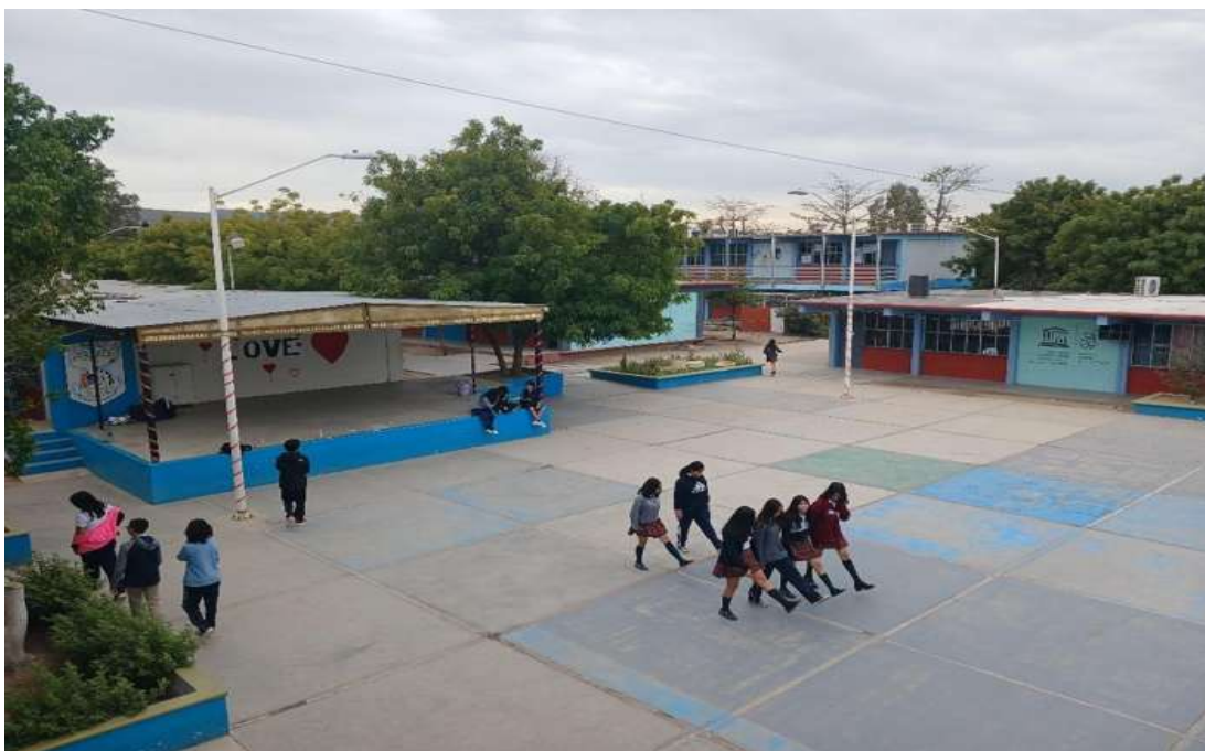
Imagen 8. Plaza cívica donde se aprecia una escolta conformada por alumnas practicando. Se aprecia el teatro al aire libre que se utiliza para realizar presentaciones artísticas y culturales, por último, se observan edificios que albergan salones de clase de las diferentes disciplinas que se imparten en la escuela.

Educativa (ILCE), como escuela piloto en su fase inicial, siendo una de las dos secundarias del estado que participaron. El programa consiste en un sistema de comunicación educativa, lo que significa una herramienta para el desempeño en el trabajo docente. También participa en el programa de escuelas asociadas a la UNESCO, que incluye a 165 países, que colaboran con programas promocionales que la organización establece en pro de la paz en forma permanente y fomenta las relaciones entre alumnos por medio de concursos, cursos y foros.