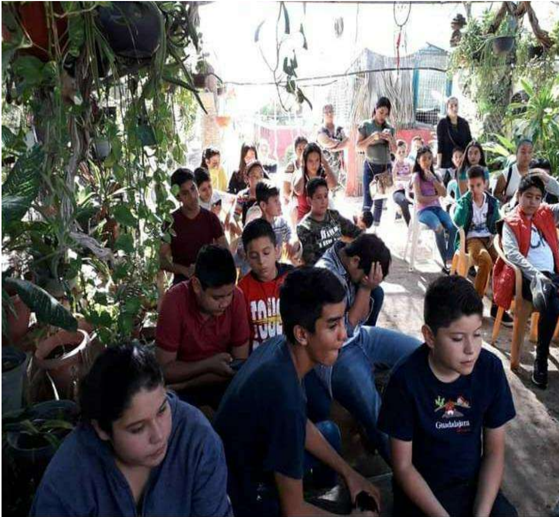
Imagen 16. Alumnos poniendo atención a la charla sobre animales endémicos de la región que impartieron en el Serpentario de La Paz, al fondo se observa a madres de familia que acompañaron a sus hijos o hijas a la visita.

única indicación que les transmití fue la de preguntar: les invité a que compartieran sus dudas, sus miedos y sus sugerencias.