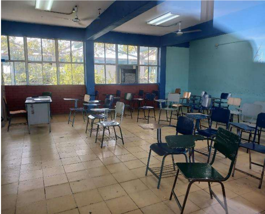
Imagen 5. Se ven los pupitres distribuidos de forma desordenada dentro del salón de clase acomodados para que los alumnos vean hacia enfrente, donde se encuentra el escritorio del docente, se aprecian los ventanales sin cortinas, la pared azul de la parte de atrás y una buena iluminación.

En conclusión, pensar, proponer y llevar a la práctica una didáctica que involucre los valores comunales, definiendo su enfoque desde el trabajo en el aula de clase y desde ese lugar en donde el alumno se siente empoderado, cómodo; un espacio que considera suyo no solo por el hecho de estar en él, sino por que dispone y gestiona la organización del mismo en virtud de sus necesidades. En este sentido, es necesario involucrar a profesores, alumnos, escuelas normales, instituciones educativas y los planes y programas en las decisiones que se toman con relación a la educación que se imparte en un contexto educativo.