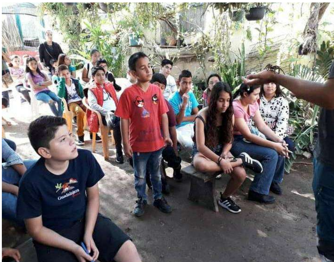
Imagen 15. Se puede observar alumnos de la Secundaria “Humberto Muñoz Zazueta” sentados en un área destinada para charlas en “El serpentario” de La Paz, están escuchando la plática de un especialista en animales endémicos de la región que les muestra algunas especies. Al fondo se aprecia una madre de familia.

En un primer momento nos dirigimos a un espacio acondicionado para charlas, donde los especialistas hablan de algunos animales de la región; al mismo tiempo les muestran las especies a los visitantes y permiten la interacción con ellos. En ese espacio permanecemos cerca de cuarenta minutos. Los alumnos se mostraron muy participativos, hacían muchas preguntas (a continuación, les muestro algunas imágenes).