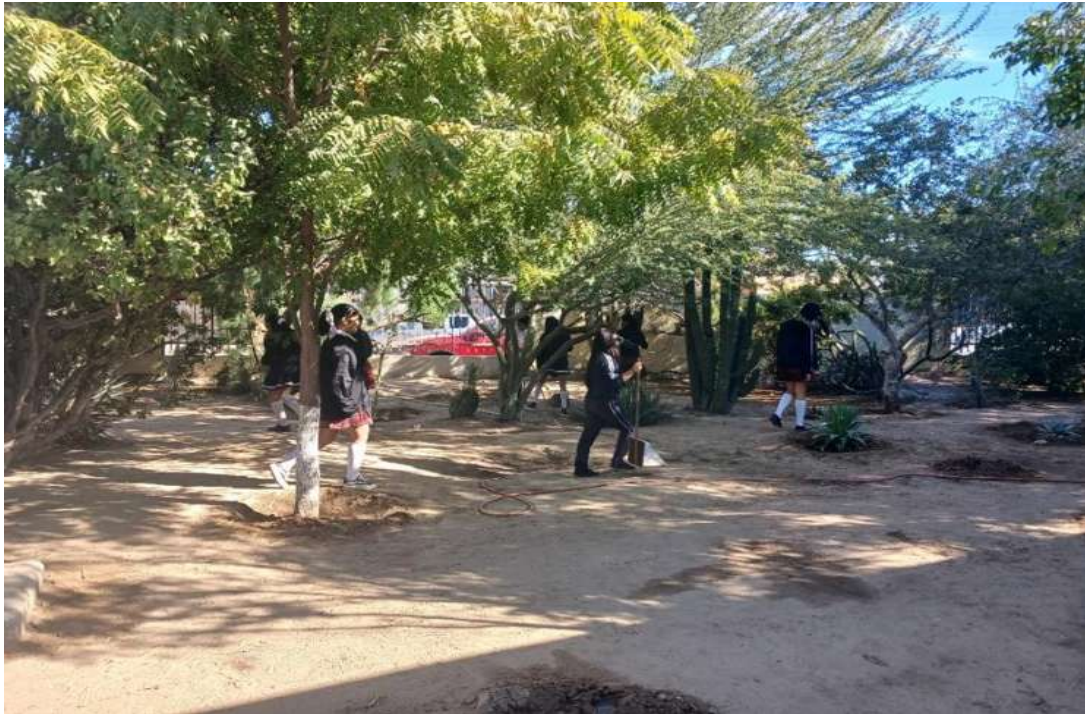
Imagen 18. Se aprecia a algunas alumnas realizando limpieza del área que se va a conservar, también se observa que las plantas ya tienen fabricada la cazuela para conservar el agua.

a resolver el conflicto a golpes, en ese momento eso había quedado en el pasado y ahora compartían uno con el otro.