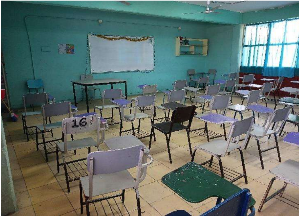
Imagen 4. Se ve un aula de clase con los pupitres acomodados por filas de seis distribuidos de forma lineal por todo el espacio del salón, acomodados para que los alumnos vean hacia el frente donde se encuentra el pintarrón y el escritorio del docente, también se aprecia un pequeño librero (sin libros), los ventanales protegidos con cortinas y una pared pintada de color azul.

“común”, donde los mesabancos se encuentran alineados en filas perfectamente establecidas, una atrás de otra y emparejada con la de un costado. Del mismo modo me parece importante mencionar que el resto del espacio solo se utiliza si el docente así lo permite, así se puede apreciar en las imágenes que a continuación se muestran: