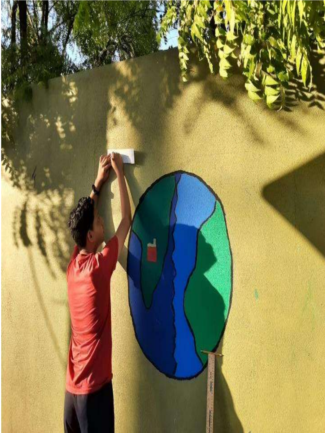
Imagen 12. Se observa a Daniel un alumno del 1:B que continua con el trabajo de sus compañeros, lo hace solo ya que por cuestiones personales le fue imposible asistir en el horario que su equipo eligio, esto refleja el compromiso de los niños y niñas con su proyecto.