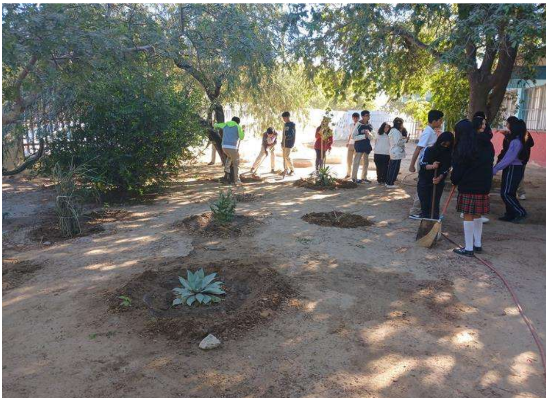
Imagen 17. De primera mano se observa a dos niñas que están limpiando el área con escoba y recogedor, al fondo se aprecia a tres alumnos fabricando una cazuela a una de las plantas, se ve a otros alumnos revisando en que pueden apoyar.

la herramienta. Se podaron algunos árboles y se trasplantaron algunas plantas. A continuación, se comparten algunas imágenes: