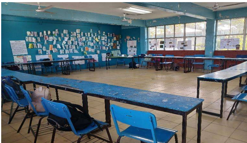
Imagen 1. Se puede ver el aula de Geografía, esta tiene como mobiliario mesas y sillas que se encuentran acomodados de forma circular, al fondo se aprecia el escritorio del docente, de fondo se aprecia la pared tapizada con trípticos y carteles realizados por los alumnos.

donde lo desee y compartir el espacio con quien quiera. Los alumnos serán los gestores del salón de clase; así mismo, al apropiarse del aula serán ellos mismos quienes utilicen el espacio basándose en sus intereses educativos, como se muestra en las siguientes imágenes: