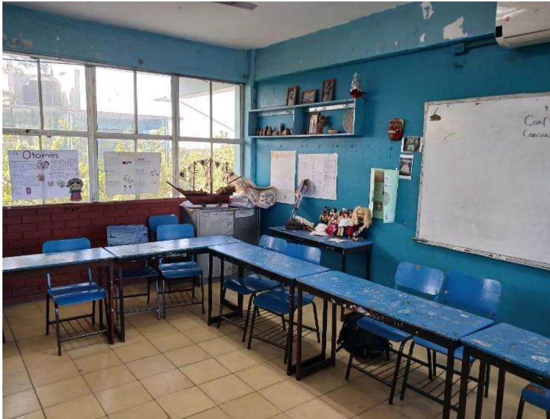
Imagen 3. Se ve un rincón del aula de Geografía, se observa una repisa que exhibe productos elaborados por los alumnos, al igual que una mesa y un mueble de color gris que sirve para guardar material que se recicla para que los alumnos lo reutilicen

Con respecto a las imágenes anteriores, debo mencionar que fue decisión de todos los involucrados que toman clase en el aula de Geografía utilizar mesas y sillas como mobiliario, a diferencia de otros salones que cuentan con pupitres. El orden de los enseres fue determinado por los alumnos y alumnas, ellos acordaron que no se iba establecer un orden; de la misma forma deciden clase tras clase donde se quieren sentar y al lado de quien quieren compartir (no existe un orden pre establecido). Por otro lado, me parece importante mencionar que los niños y las niñas hacen uso de cualquier espacio dentro del aula, pueden sentarse o acostarse en el suelo si así lo consideran pertinente; también hacen uso de las paredes o ventanales con la finalidad de exponer sus productos, en pocas palabras se apropiaron del salón de clase.