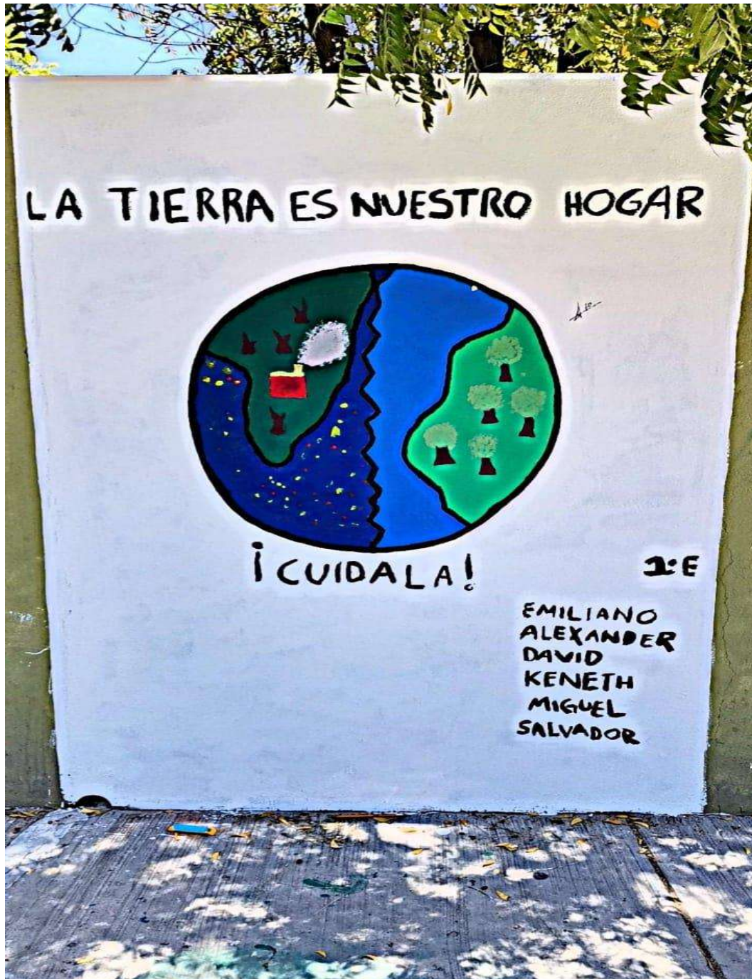
Imagen 10. Se puede apreciar el mural que realizaron alumnos del 1: E, el dibujo nos advierte sobre dos visiones del planeta, por un lado, contaminado y el otro cuando cuidamos el medio ambiente.