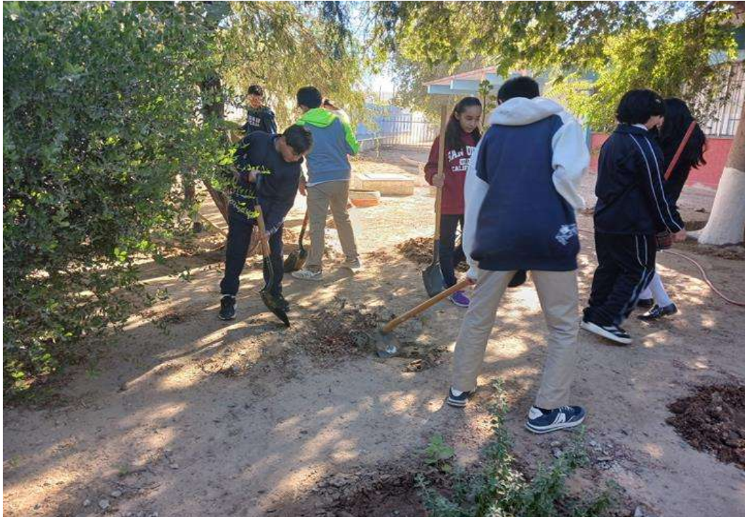
Imagen 20. En primer plano se observa a dos niños fabricando una cazuela, a un costado tres niñas buscando donde pueden apoyar y al fondo tres jóvenes realizando tequio.

Para acabar con este apartado es preciso señalar el impacto que tuvo realizar tequio para recuperar un área verde que se encontraba en total descuido dentro de la institución educativa. Los alumnos comprometidos con el tequio salían del salón de clase emocionados a realizar las labores de recuperación; cada uno entendía y estaba consciente de su labor. Me tocó observar que alumnos de otros grados y grupos se acercaban a ellos para investigar sobre la actividad y los protagonistas del proyecto contestaban con lujo de detalle; también invitaban a sus compañeros a no tirar basura. Durante las primeras jornadas de tequio tuvimos la visita de los directivos de la escuela, autoridades de SEP estatal y personal administrativo y docente de la escuela, que realizaban comentarios de aliento hacia los niños y niñas.