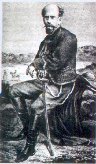
General Vicente Riva Palacio

VII. Vicente Riva Palacio establecería como su centro de operaciones militares la ciudad de Zitácuaro en el transcurso de la guerra de intervención francesa.