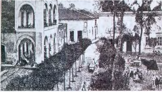
Ciudad de Zitácuaro en el siglo XIX

VII. Vicente Riva Palacio establecería como su centro de operaciones militares la ciudad de Zitácuaro en el transcurso de la guerra de intervención francesa.