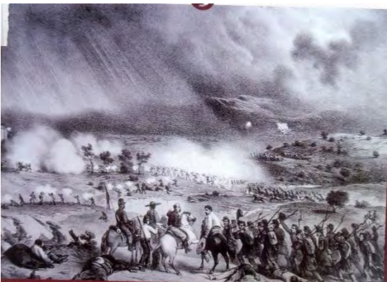
Acción del 5 de Julio en Zitácuaro.

VIII. Retrato realizado por Manuel Ocaranza hecho en los años de la campaña en 1865.