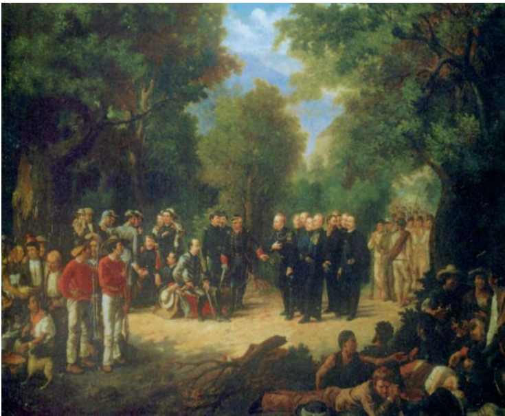
El perdón de los Belgas

X. La labor destacada del general Vicente Riva Palacio permitió consolidar la formación del Ejército del Centro, la cual combatió gran parte de sus campañas bélicas en el territorio del Estado de Michoacán.