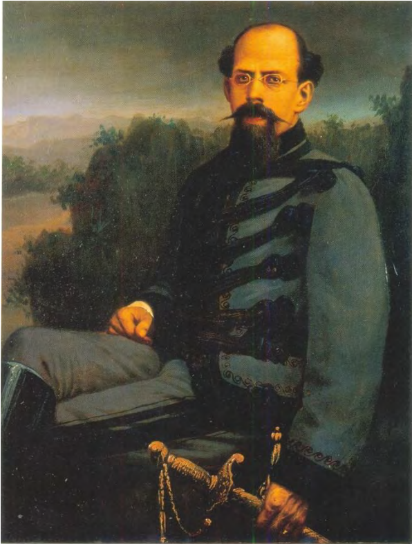
General Vicente Riva Palacio

X. La labor destacada del general Vicente Riva Palacio permitió consolidar la formación del Ejército del Centro, la cual combatió gran parte de sus campañas bélicas en el territorio del Estado de Michoacán.