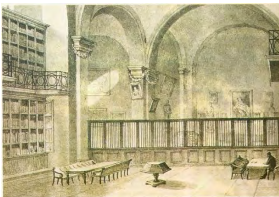
Biblioteca del Colegio de San Gregorio.

II. Vicente Riva Palacio y Guerrero nacería en la ciudad de México el 16 de octubre de 1832 siendo bautizado en la parroquia del Sagrario metropolitano.