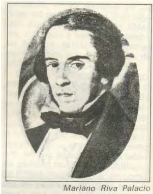
Mariano Riva Palacio

I. Mariano Riva Palacio político liberal quien en el transcurso de su vida desempeñaría varios cargos públicos destacando el haber sido ministro de Hacienda, gobernador del Estado de México en tres ocasiones y diputado federal en varias legislaturas.