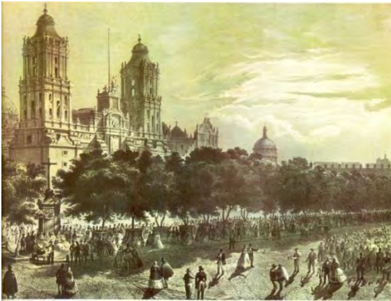
Catedral de la ciudad de México.

I. Mariano Riva Palacio político liberal quien en el transcurso de su vida desempeñaría varios cargos públicos destacando el haber sido ministro de Hacienda, gobernador del Estado de México en tres ocasiones y diputado federal en varias legislaturas.