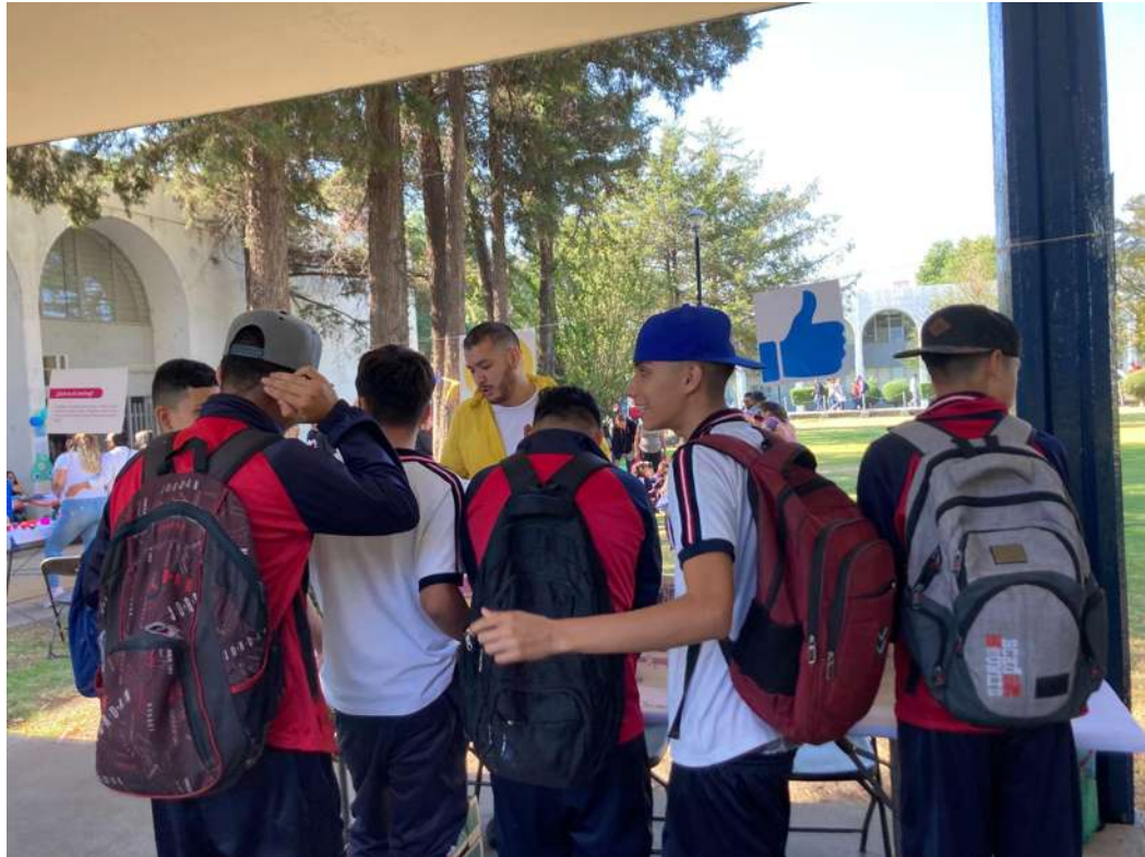
Figura 7. Concientización sobre violencia sexual digital en la Universidad UMSNH, participación de este proyecto de la Maestría en Filosofía de la cultura en el Tianguis de la Ciencia 2023.