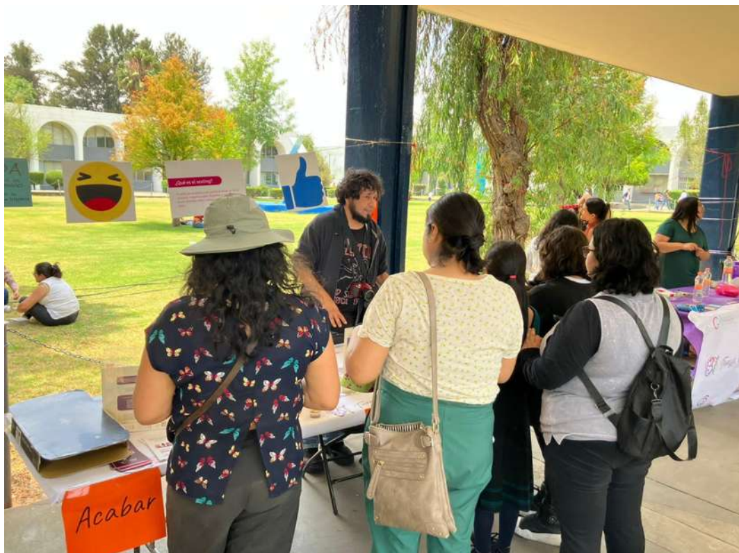
Figura 5. Concientización sobre violencia sexual digital en la Universidad UMSNH, como parte de la participación de este proyecto en la Maestría en Filosofía de la cultura en el Tianguis de la Ciencia 2023.