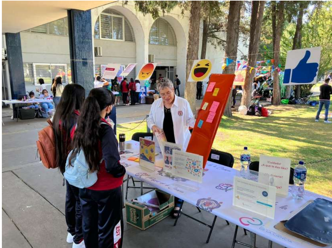
Figura 6. concientización sobre violencia sexual digital en la Universidad UMSNH, participación de este proyecto en Filosofía de la cultura en el Tianguis de la Ciencia 2023.