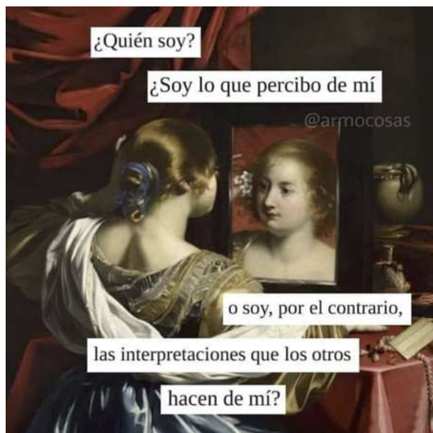
Figura 4.

Es común encontrar personas que afirman que nadie puede dañar tu interior si tú no se lo permites, considero que esto es real hasta cierto límite. Si una persona te dice algo es posible ignorar y continuar, si dos personas te dicen lo mismo es posible ignorarlas, si tres personas te dicen lo mismo llega la duda: ¿Por qué me están diciendo eso? En el caso de violencia digital la cantidad de comentarios dañinos puede venir de miles de personas. Es una cantidad exorbitante de personas opinando sobre alguien más.