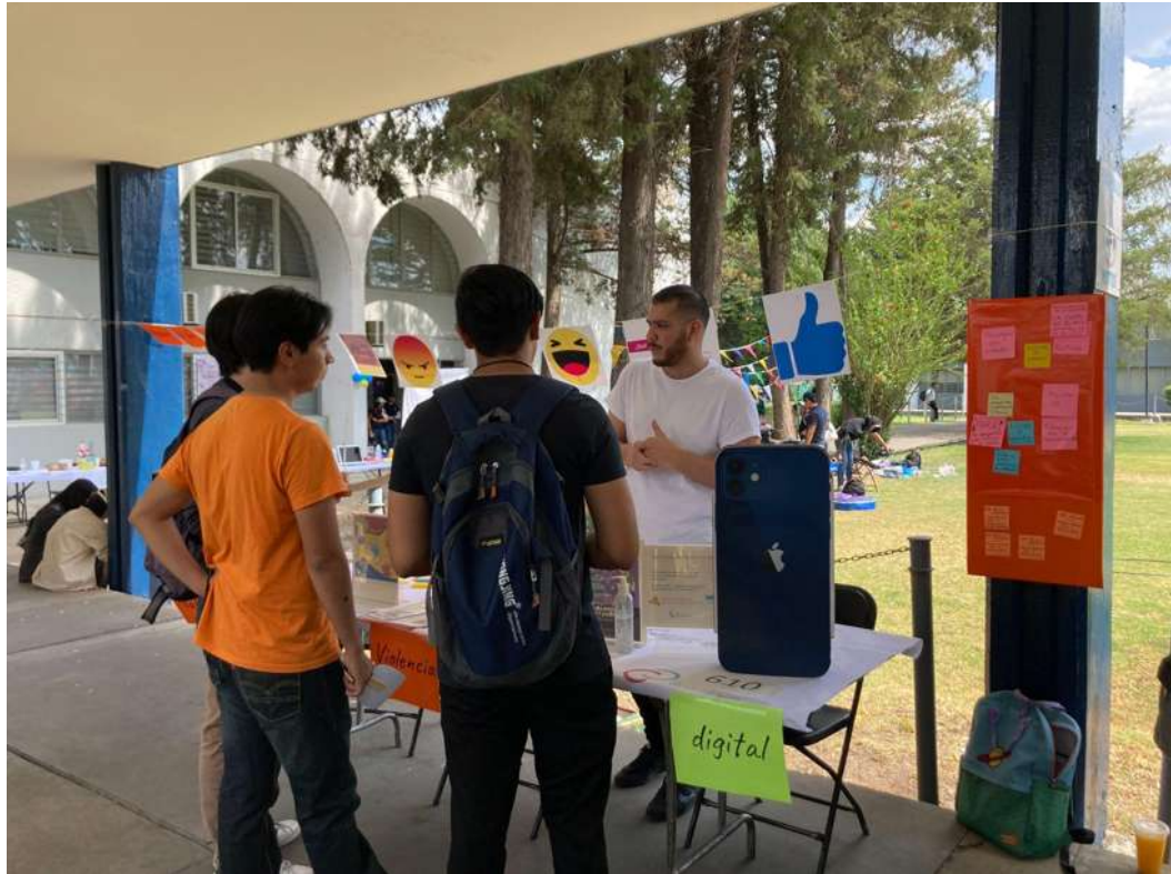
Figura 8. Concientización sobre violencia sexual digital en la Universidad UMSNH, como parte de la participación de este proyecto de la Maestría en Filosofía de la cultura en el Tianguis de la Ciencia 2023.