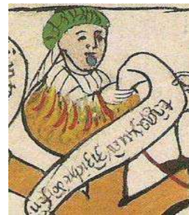
Don Francisco Tzintzicha Tangaxoan en la lámina “genealogía de los señores de

su culpabilidad, se le dio la opción de morir a “garrote” y solo posteriormente ser calcinado. La otra, la de los declarantes en el juicio de Cortés, proclama que don Francisco murió quemado. 241 El significado de una muerte u otra radicaba en intereses bien identificables en ambos casos. En principio debemos recordar que el cazonçi, en su encuentro con los franciscanos residentes en México-Tenochtitlan, se había bautizado alrededor de 1525 y, como cristiano que era, no le correspondía morir quemado. Más aún, un juez hispano no podía permitir o promover que esto pasara. Por el otro lado, y siendo uno de los cargos el de haber regresado a la idolatría, Nuño de Guzmán argumentó que en realidad no era cristiano. Sin embargo, si la sentencia de Guzmán era valedera, también le permitía hacerse de todos los bienes del cazonçi. Así lo asienta en el proceso.