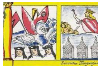
Cuadrantes inferiores del escudo de “Armas del señorío de Tzintzuntzan”.

El escudo de armas bajo el nombre de “Armas del Señorío de la ciudad de Tzintzontza” que reproduce está dividido en tres tercios, uno superior y dos que dividen la parte inferior. En el superior se encuentran los tres reyes que antecedieron el arribo español a Michoacán aunque con nombres modificados a los que se encuentra en la Relación de Michoacán : Chiguacan en lugar de Tzitzizpandácuare, Sinsincha en lugar de Tangaxoan Tzintzicha y Chiguangua en lugar de Zuangua. 254 De igual manera, en el espacio inferior izquierdo se encuentran las armas y pendones españoles, tres señores vestidos como españoles con sombrero y ropas blancas, mientras que en la parte derecha se encuentra a don Francisco Tzintzicha Tangaxoan en una loma que tiene como base tres capillas ante un grupo de cabezas – convención para representar a la población indígena. Don Francisco viste túnica y capa, cabello largo y corona y lleva en su mano izquierda un crucifijo. Debajo del cuadrante de la imagen está escrito Sinsicha Tangajuan. Esta es la imagen de rey que trajo el cristianismo a los indios de su grey que hemos estado mencionando. De tal manera, la tradición sobre don Francisco Tangaxoan Tzintzicha fue alimentada por tres siglos, proporcionando identidad a la población de Tzintzuntzan y propaganda a los cronistas franciscanos.