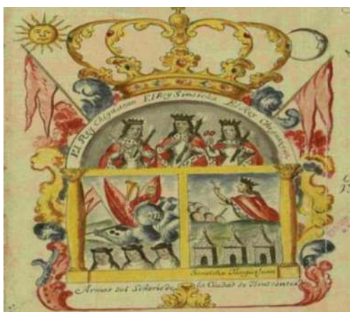
Armas del señorío de la ciudad de Tzintzuntzan.

El uso hecho de don Francisco como aliado a los franciscanos viene desde el tiempo de la redacción de la Relación Michoacán en 1538-1541, sin embargo el tema se reutilizó en los siguientes siglos, también por parte del cabildo indígena de Tzintzuntzan. El gobierno indio de esta ciudad habría mantenido por medio de la oralidad la tradición del cazonçi como el gobernante que dio la ascendencia de la ciudad de Tzintzuntzan como la ciudad de Michoacán y a don Francisco como el “rey” que llevó, junto con los franciscanos, “la verdadera fe” a Michoacán. La ayuda de la memoria habrían sido un conjunto de imágenes que se encuentran a caballo entre la tradición emblemática europea y la indígena. Dentro de ellos estarían copias de las pinturas presentadas en los pleitos entre la ciudad de Tzintzuntzan y la de Pátzcuaro, así como contra Vasco de Quiroga. 252 De tal manera, fray Pablo Beaumont al redactar su Crónica de Michoacán 253 habría copiado, bajo los caracteres del siglo XVIII, estas imágenes.