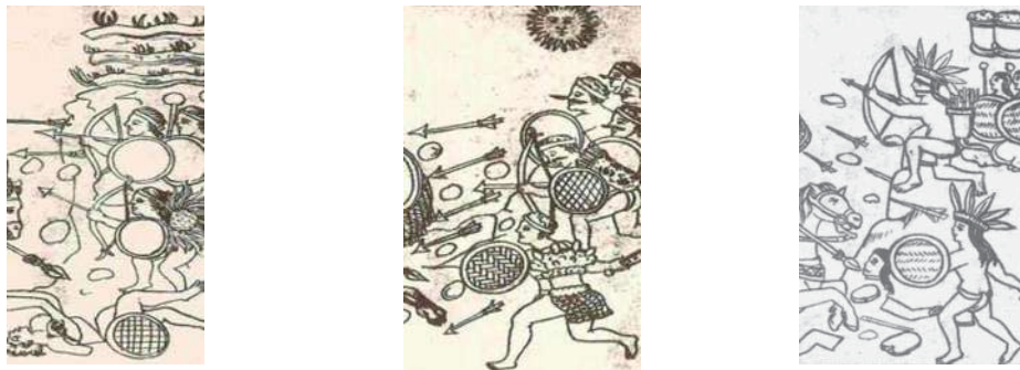
Tres imágenes de igual número de etnias “chichimecas” peleando contra españoles en la Descripción de la ciudad y provincia de Tlaxcala .

La carta, además, es prolija en los símiles entre los chichimecas y los moros. Por ejemplo, el agustino comunica a Felipe II que él estima que las leyes que se aplican y que tienen como base la igualdad, –“leyes de justicia”, las llama– no deben de ser utilizadas para los chichimecas, ya que para ellos se deberían de utilizar las leyes de los “moros”. 567